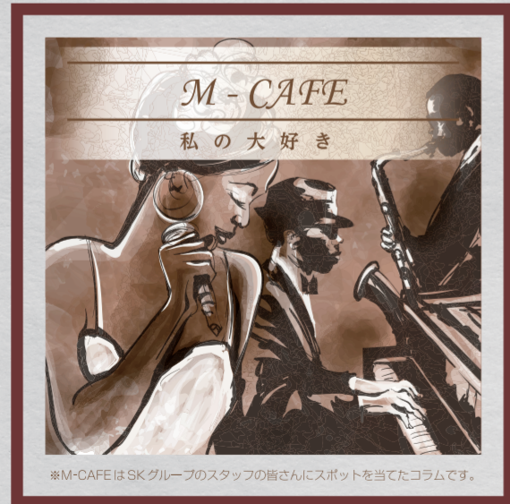
*M-CAFEはSKグループのスタッフの皆さんにスポットを当てたコラムです。

毎日作業終わりににはリフトを拭いたり点検したりなど、とても大切に扱っているようです。近々、新しく【フォークシフター】というリフトが仲間入り予定。フォークのツメ幅がレバー1つで変えられるというリフトに2人とも待ちきれない様子でした。