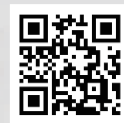
公式ホームページ

近年、世界におけるごみ問題が深刻な状態にあります。2000年以降、日本でもリサイクル率は上昇し続けていますが、世界的に見るとまだまだ高いとは言えません。私達一人ひとりがリサイクル意識を持ち、持続可能な循環型社会を作っていくために、私達エス・ライナーがお手伝いいたします。