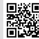
公式ホームページ