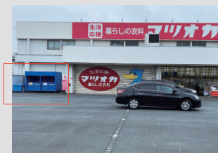
【マツオカ 名塚店】浜松市中央区名塚町241-1 ▶