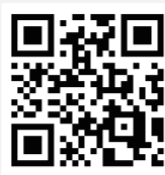
公式ホームページ