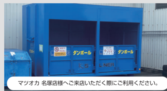
マツオカ 名塚店様へご来店いただく際にご利用ください。

今回ご紹介する回収スポットは、お客様の「株式会社コスモマツオカ」様です！ （株）コスモマツオカ様の店舗「暮らしの衣料 マツオカ 名塚店」に、鮮やかなSKブルーに塗られた専用コンテナを設置させていただきました。こちらはダンボールの回収のみ行ってまいります。