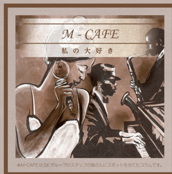
*M-CafeはSKグループのスタッフの皆さんにスポットを当てたコラムです。

エコプラント株式会社 所在地 浜松市中央区新橋町2265番地の1 連絡先 053-444-2578